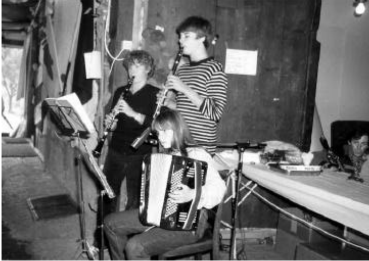
Animation musicale lors de nos soirées