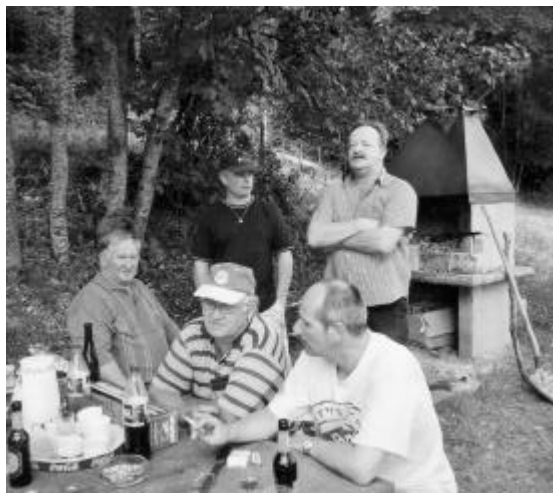
Le coin «barbecue» et pique-nique