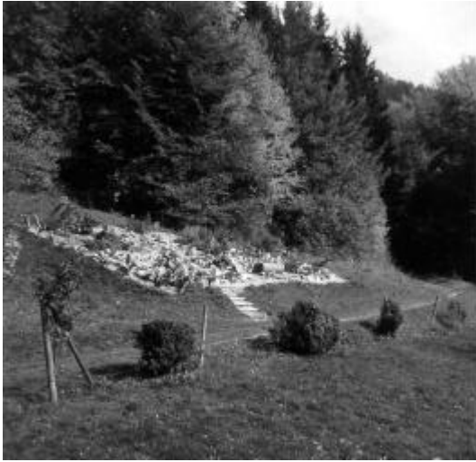
Le jardin botanique