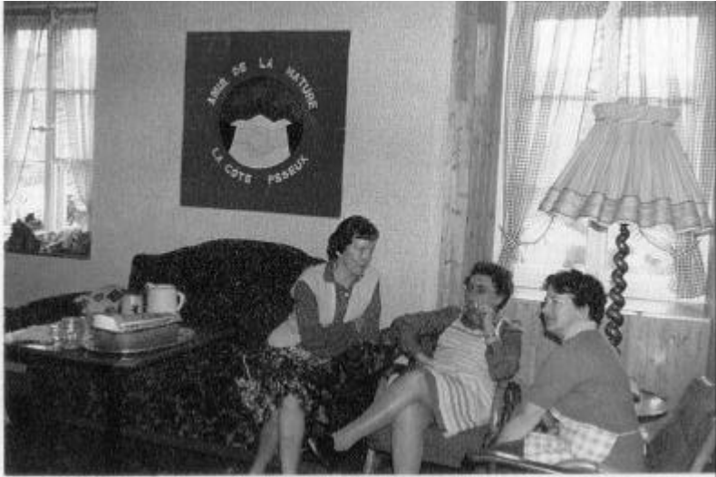
Le salon est transformé en réfectoire