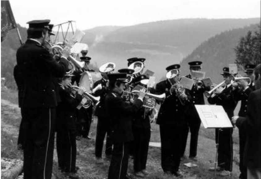
Inauguration du 6 juillet 1980