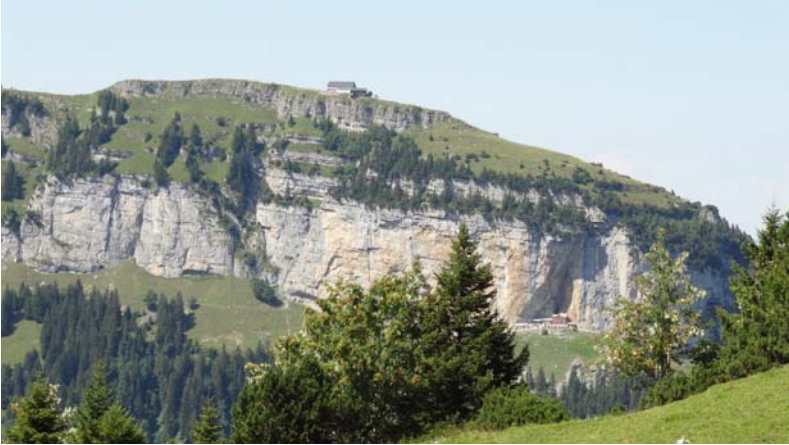
Bergstation Ebenalp et Äscher Wildkirchli

Chers Ami(e)s de la Nature et hôtes, La 54ème semaine internationale de randonnées des Amis de la Nature aura lieu du 21 au 28 juillet 2018 à Urnäsch. Urnäsch, un charmant village dans le canton d'Appenzell au milieu des montagnes. Non seulement la Schwägälp et le Säntis sont bien près, il y a des possibilités de randonnées dans toutes les directions. Nous avons trouvé un hôtel confortable et bien situé à un prix convenable. La semaine en demi-pension avec pique-nique et des randonnées guidées au prix de CHF 950.- par personne en chambre double.